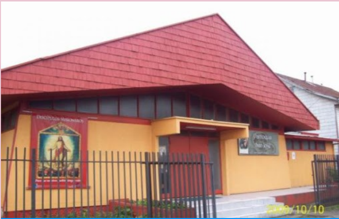
Parroquia San José Guillermo Francke 182