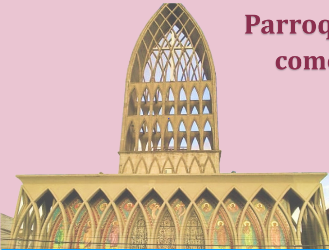
Catedral San Mateo Apóstol Manuel Antonio Matta 662