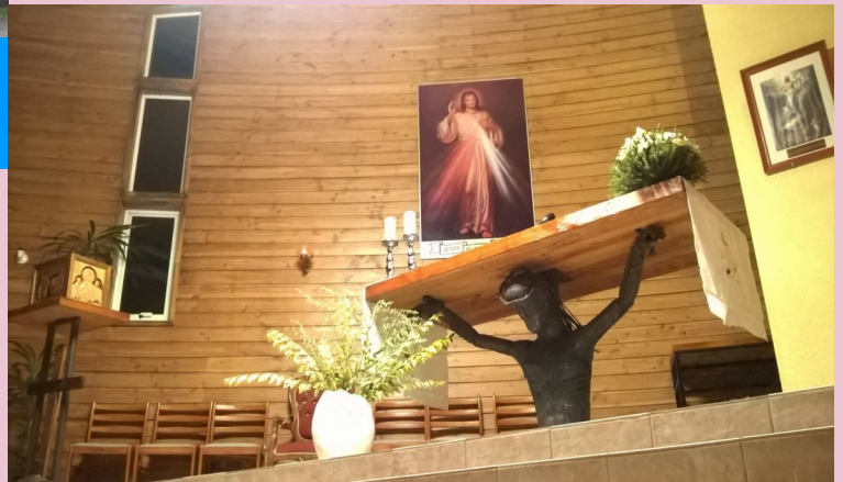
Capilla Santa Clara Parinacota esquina Chorrillo, Rahue Alto