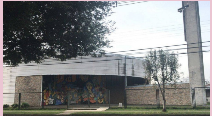
Parroquia Santa Rosa de Lima Zenteno esquina el Alba S/N