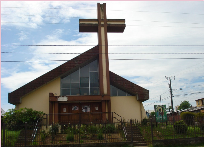
Capilla Nuestra Señora de Czestochowa Calle Loncoche 2739, Pbl. V Centenario