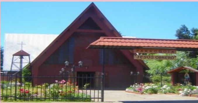
Parroquia Jesús Obrero José Domingo Negrón s/n , Rahue Alto