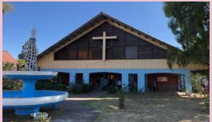
Parroquia Nuestra Señora de Lourdes Talca 376, Rahue Bajo