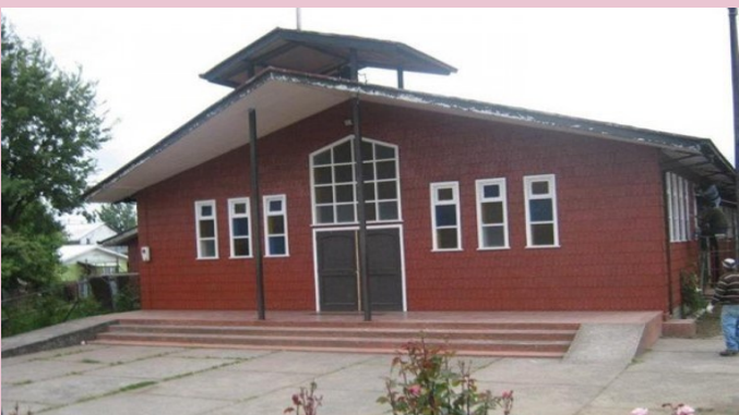
Parroquia San Leopoldo Mandic Queilén s/n, Pb. Las vegas, Rahue Alto