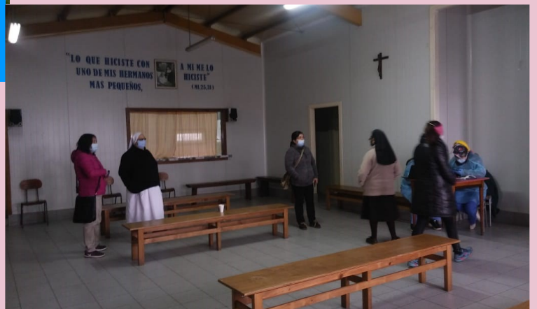
Comedor Abierto "Olla Solidaria María Josefa" Población V Centenario